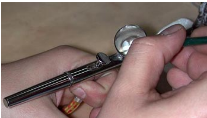
Llenado de la copa mediante un pincel copa