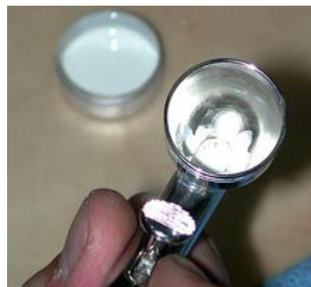
La pintura situada en la