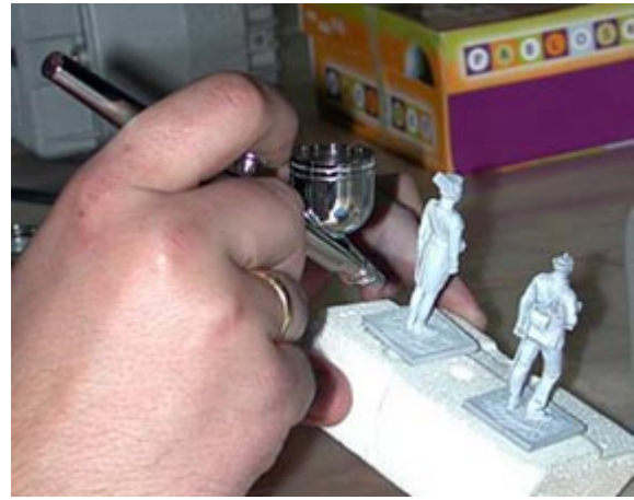
Proceso de Imprimación

Una vez finalizado el proceso de imprimación, es obligatorio limpiar bien el aerógrafo. Para ello llenaremos la copa hasta al mitad con alcohol de quemar y la vaciaremos completamente. Durante el proceso de vaciado es bueno dar unos cuantos cortes de pintura, esto es, manteniendo el flujo de aire abierto al máximo iremos cortando y abriendo el caudal de pintura, de esta manera el aerógrafo escupirá borbotones de pintura que se quedan entre la boquilla y la cazoleta. Acabado ese medio depósito de alcohol sacamos la aguja y la limpiamos de atrás a adelante con un algodón suave empapado en alcohol. Con un bastoncillo de los oídos también empapado en alcohol limpiamos la cazoleta, el protector de la aguja, etc.. Volvemos a montar todo y rellenamos otro medio depósito de alcohol el cual vaciamos como antes.