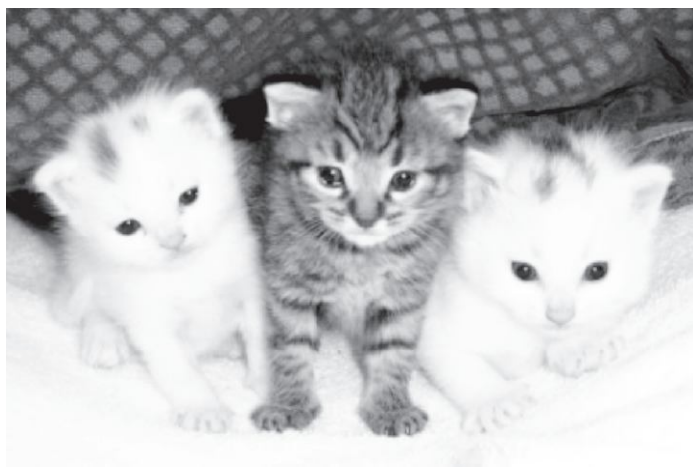
Figura 6 (Anónimo, 2001). El primer año de vida del gato se conoce por tres fases: Explorar, Jugar y Crecer.

El primer año de vida de un gato corresponde, en términos de desarrollo, a los primeros 14 años de vida de un ser humano (Figura 6). Después de su segundo año, el gato tendría 24 en una edad humana. Después de que sucede eso, cada año de vida del gato corresponde a 6 años nuestros (Rivas Pérez y Ramírez Ramírez, 2005).