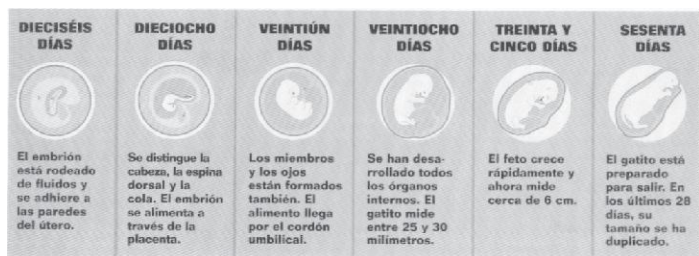
Figura 8. (Puentes, H. 2003) Gestación del gato.

Si después de ese periodo de tiempo no han nacido, se necesitará la ayuda del veterinario para la cesárea, la cual consta de un corte vertical de 3 a 6 cm. Al nacer los gatitos pesaran alrededor de 100 gramos. Cada camada puede constar de 3 a 8 gatos. Tan pronto nace el gatito, la hembra lo lame para retirarle la membrana que lo rodea y así estimular su respiración, la hembra se come la placenta para obtener nutrientes para la producción de leche (Puentes, 2003 y Rivas Pérez y Ramírez Ramírez, 2005) (Figura 9).