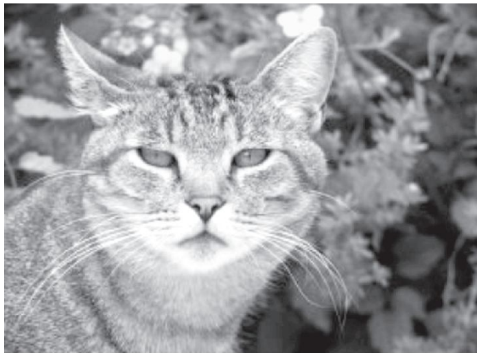
Figura 15.. Al ser de carácter independiente, cariñoso, limpio y Ágil, los Romanos optaron por el Gato para librarse de las Ratas, desplazando a la comadreja para siempre.

A diferencia del pueblo egipcio, los griegos lo consideraron simplemente un animal útil (Esopo lo recrea solamente en tres de sus famosas fábulas, y lo hace precisamente resaltando sus cualidades más negativas), al igual que los romanos, con el cual sustituyeron a la comadreja en la lucha contra las ratas (Figura 15).