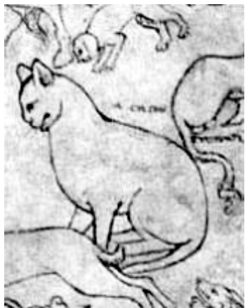
Figura 3 (Imagen de Benavides, et al. 2002). De ser un animal salvaje y odiado en su momento por el hombre el gato pasó a convertirse en su leal compañero.