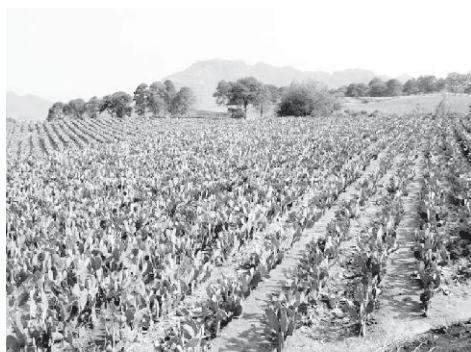
Figuras. 1 y 2. Las plantas fueron las primeras especies domesticadas por el hombre, de ahí siguieron los mamíferos menores, siendo el gato último en domesticar.

Comparados con otros animales domesticados tales como las reses, los caballos, las cabras, los borregos, los cerdos, los asnos, los cebúes, los dromedarios o aquellos originarios de nuestro continente como el pavo o el cobayo, los gatos representan una de las especies más recientemente domesticadas, casi a la par de los pollos y probablemente de la llama (Figura 3). Es por esta razón que inicia el interés por conocer algunos datos del animal con mayor presencia en el mundo. (Benavides, H., et al. 2002 y Téllez Girón, 1999)