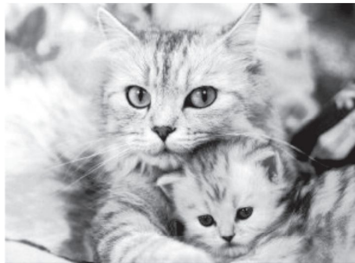
Figura 10 (Puentes, H. 2003). Las excretas de los mininos tanto adultos como pequeños son ricas en Urea.

Sus excretas son excelente abono para las plantas y su orina proporcionan urea y sales en beneficios de las plantas. Evita la erosión de suelo ya que con sus garras entierra sus excremento y remueve la tierra, permitiendo la rotación de aire y nutrientes (Rivas Pérez y Ramírez Ramírez, T. 2005).