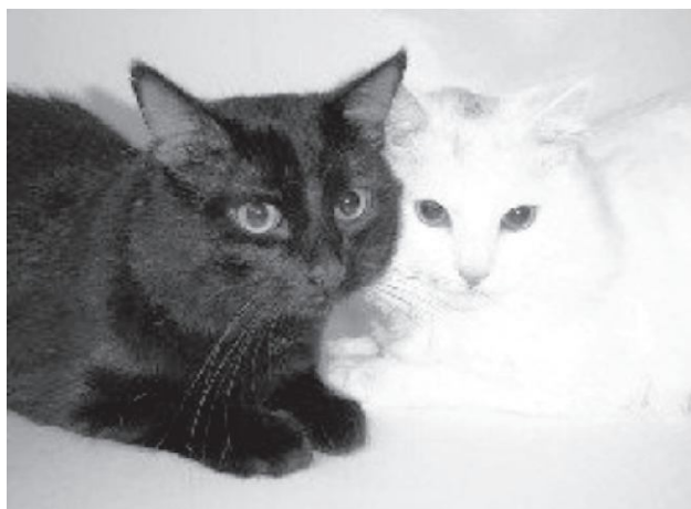
Figura 18 (Anónimo, 2001). Contrariamente a lo que se piensa, los gatos son los animales con un impecable sentido de limpieza.

La caza a las "brujas" fue abolida oficialmente en 1790, cuando Napoleón declaró su amor hacia los gatos, para contener la plaga de ratas. El avance de la civilización consiguió, devolver al gato su status de animal tranquilo, afable y doméstico. Durante la época de Pasteur, y con el descubrimiento de las bacterias, la sociedad, aterrorizada por esos invisibles seres portadores de enfermedades, volvió la mirada hacia al gato. Las bacterias gustaban de vivir en la suciedad y el gato era paradigma de la limpieza, (Figura 18) por lo tanto, el único animal digno de vivir con el hombre (Rivas Pérez y Ramírez Ramírez. 2005).