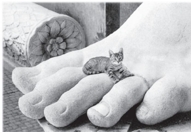
Figura 16 (Benavides, et al. 2002). Actualmente el coliseo romano alberga unos 3500 gatos, los cuales son alimentados por los turistas y por las aves migratorias.

Más tardía fue la llegada del gato doméstico a Europa, cuya difusión corrió a cargo probablemente de los romanos, para los cuales el gato representaba la victoria en sus conquistas (Figura 16).