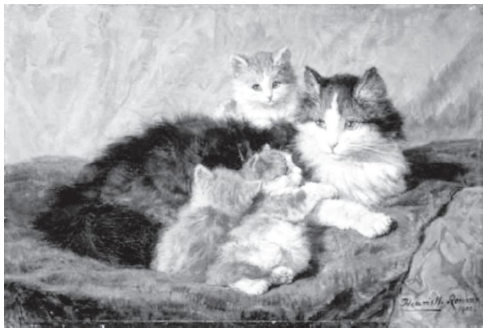
Figura 9 (Puentes, H. 2003). El periodo de Lactancia de los gatos dura entre un mes y medio a 3 meses.

Si después de ese periodo de tiempo no han nacido, se necesitará la ayuda del veterinario para la cesárea, la cual consta de un corte vertical de 3 a 6 cm. Al nacer los gatitos pesaran alrededor de 100 gramos. Cada camada puede constar de 3 a 8 gatos. Tan pronto nace el gatito, la hembra lo lame para retirarle la membrana que lo rodea y así estimular su respiración, la hembra se come la placenta para obtener nutrientes para la producción de leche (Puentes, 2003 y Rivas Pérez y Ramírez Ramírez, 2005) (Figura 9).