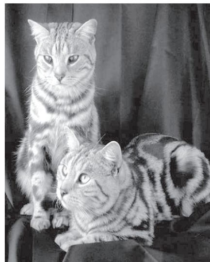
Figura 17 (Anónimo. 2001). La persecución de la inquisición hacia los gatos y sus dueños se debió al miedo y fobias que la iglesia católica provocó.

En la Edad Media, (periodo de 476 a 1453), en Europa, los gatos cayeron en descrédito cuando la iglesia católica acusó de brujería a los practicantes de los ritos paganos (Figura 17). Los gatos de las personas martirizadas eran tratados con la misma crueldad. Millares de mujeres inocentes fueron acusadas de brujería, ahogadas o quemadas vivas con sus gatos (Téllez Girón, 1999).