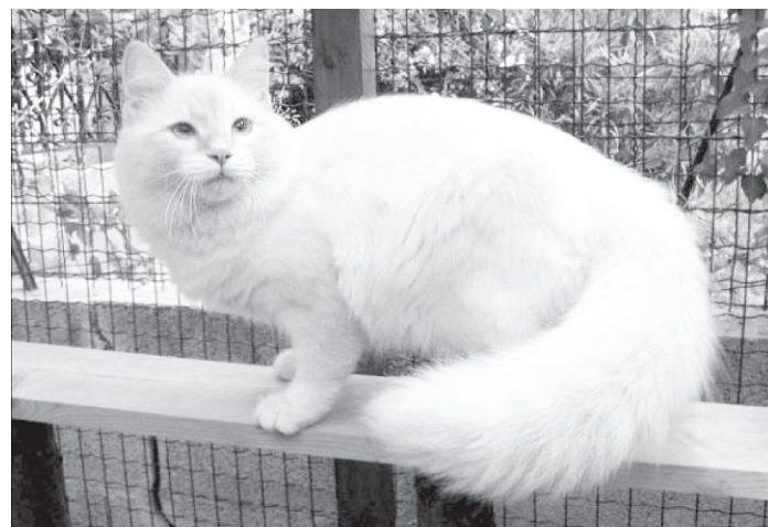
Figura. 5 (Anónimo, 2001). Los Gatos siempre han sido dueños y señores del territorio que habitan.

Nombres comunes: Micho, Micifuz, Miau, Gato y Cat. (Outremer, F. 2005).