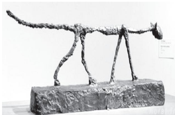
Figura 4 (Imágenes de Benavides, et al. 2002). Los miácidos se caracterizaron por ser rápidos y de mente ágil.

El gato pertenece a la familia de los félidos; cuya característica principal es la de ser carnívoros. Sus más remotos antepasados pueden ubicarse en el Eoceno (65 millones de años atrás) y alcanzaron su desarrollo a partir de los fisípedos, considerados como los ancestros de todos los carnívoros (Figura 4). Estos animales eran pequeños, pero poseían las características y la estructura de magníficos depredadores. A partir de esta línea surgieron los miácidos, estos eran animales de cerebro más desarrollado que sus antecesores, y dotados de unas características morfológicas que los hacían aptos para la depredación, lo que permitió su supervivencia y su difusión. (Chumacera, G. y Torres, V. 2004.)